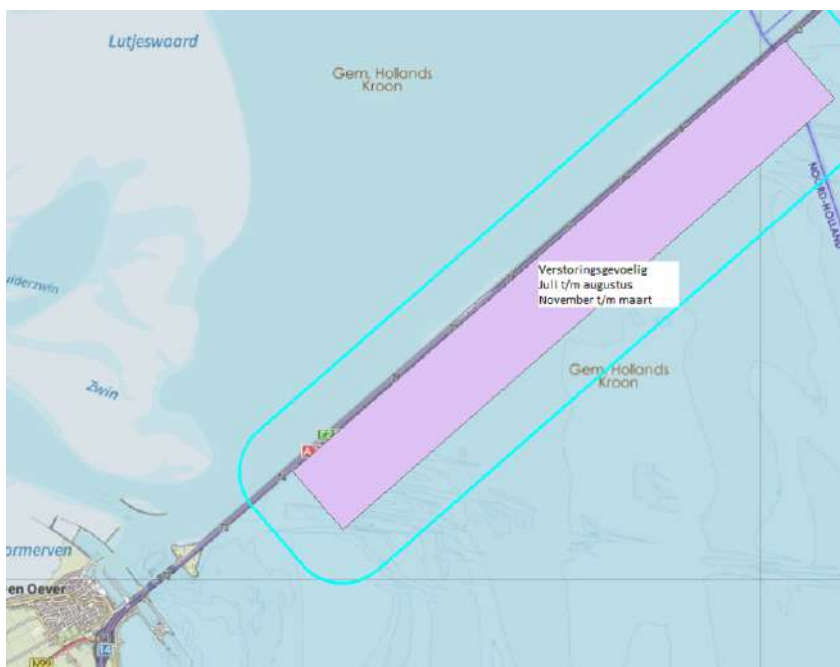
Figuur 4.6c. Verstoringsgevoelige gebieden IJsselmeer niet-broedvogels. In de aangegeven periode geldt een verstoringszone van 700 m. De delen in Friesland en Flevoland blijven buiten beschouwing.