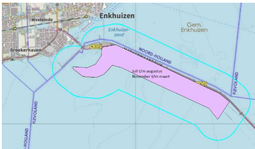
Figuur 4.8a. Verstoringgevoelige gebieden Markermeer en IJmeer niet-broedvogels. In de aangegeven periode geldt een verstoringzone van 700 m. De delen in Flevoland blijven buiten beschouwing.