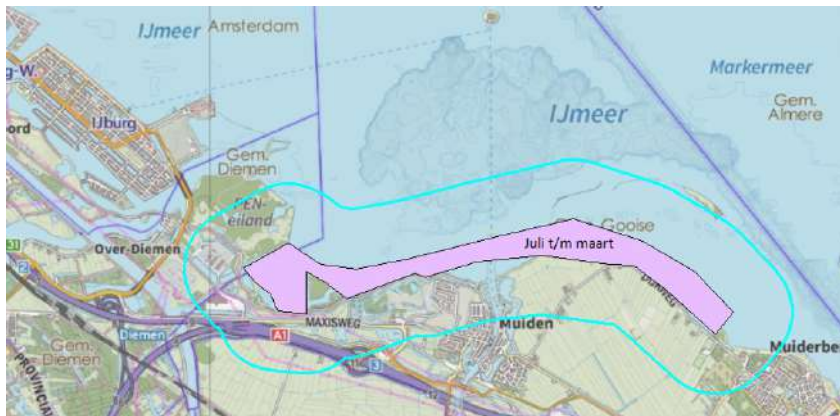
Figuur 4.8d. Verstoring gevoelige gebieden Markermeer en IJmeer niet-broedvogels. In de aangegeven periode geldt een verstoringzone van 700 m. De delen in Flevoland blijven buiten beschouwing.