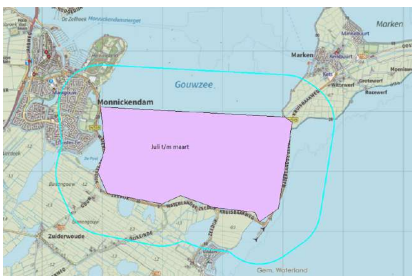
Figuur 4.8c. Verstoringgevoelige gebieden Markermeer en IJmeer niet-broedvogels. In de aangegeven periode geldt een verstoringzone van 700 m. De delen in Flevoland blijven buiten beschouwing.