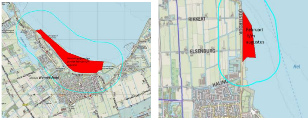
Figuur 4.5. Natura 2000-gebied IJsselmeer, locaties met broedende vogels. Rondom deze locaties geldt een verstoringsafstand van 700 m. Vuurwerk binnen deze bufferzone dient nader onderzocht te worden op aanwezigheid van broedvogels, indien: afgestoken in de periode februari tot en met augustus.