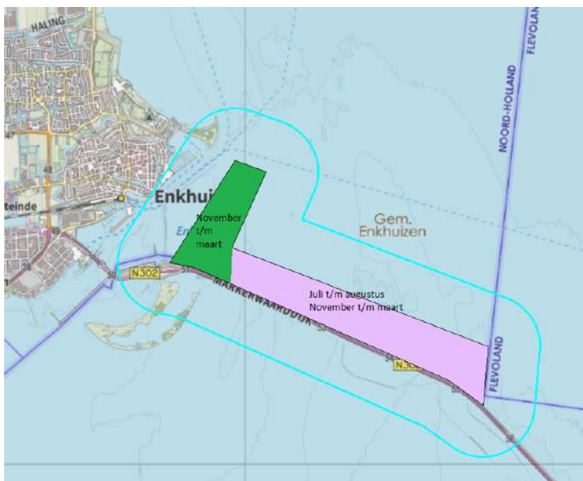
Figuur 4.6a. Verstoringgevoelige gebieden IJsselmeer niet-broedvogels. In de aangegeven periode geldt een verstoringszone van 700 m. De delen in Friesland en Flevoland blijven buiten beschouwing.