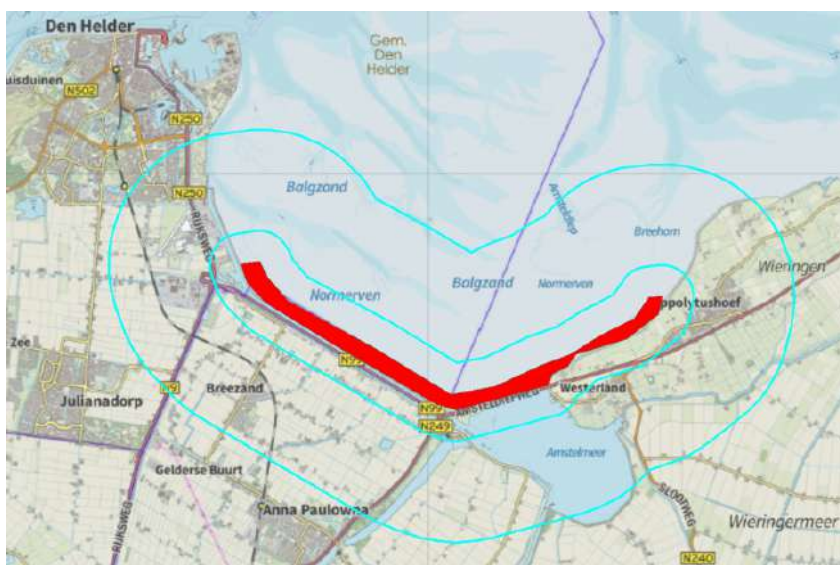
Figuur 4.11. Natura 2000-gebied Waddenzee. Broedgebied bij Balgzand inclusief 700 meter bufferzone in de periode april t/m juli. Daarnaast geldt jaarrond een 3 km zone omdat het tevens een hoogwatervluchtplaats betreft.