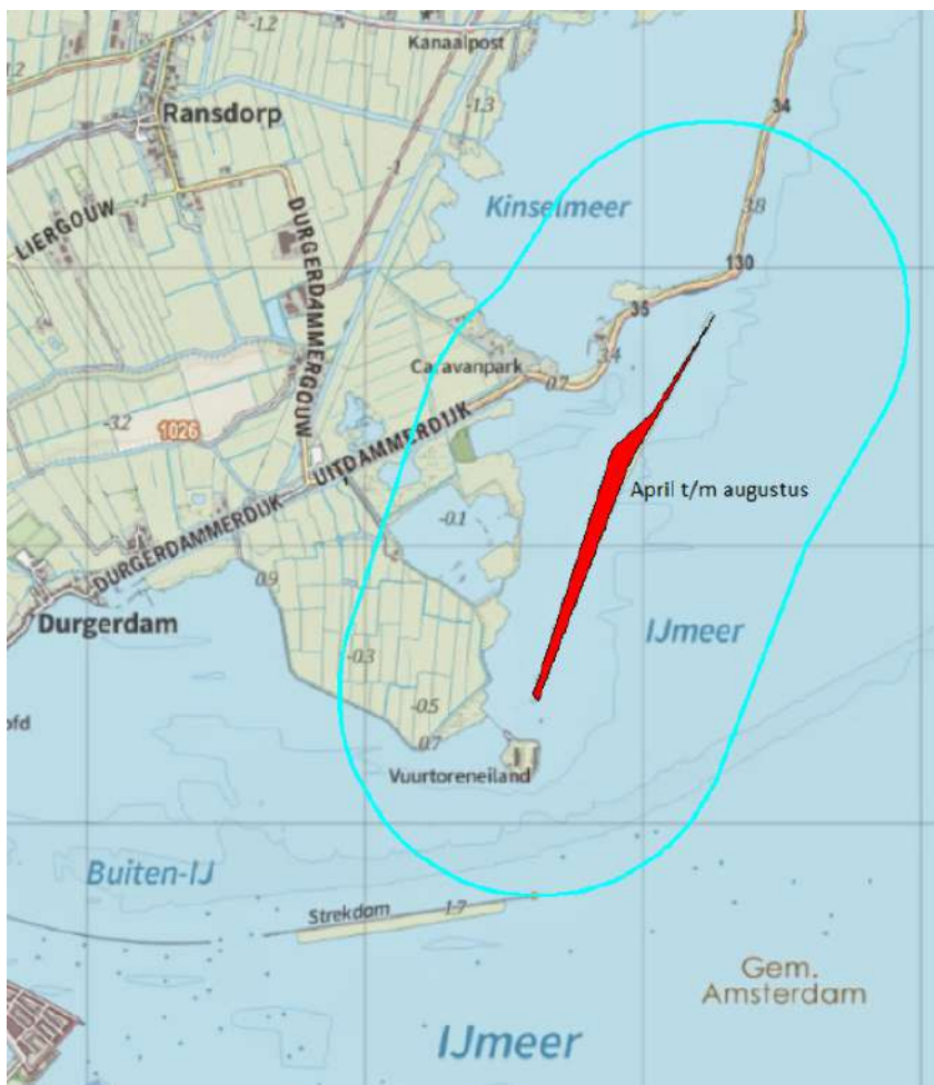
Figuur 4.7. Verstoringgevoelige broedgebied Markermeer en IJmeer. In de aangegeven periode geldt een verstoringzone van 700 m. De delen in Flevoland blijven buiten beschouwing.