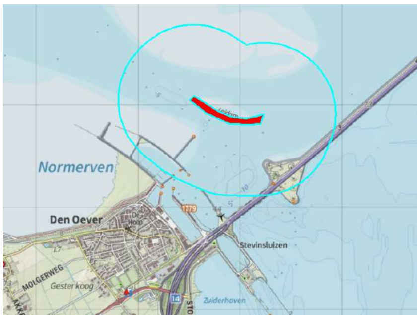
Figuur 4.10. Natura 2000-gebied Waddenzee. Broedkolonie lepelaar bij de Leidam (de Banaan) inclusief 700 meter bufferzone in de periode april t/m juli. Hoogwatervluchtplaatsen staan niet op kaart.