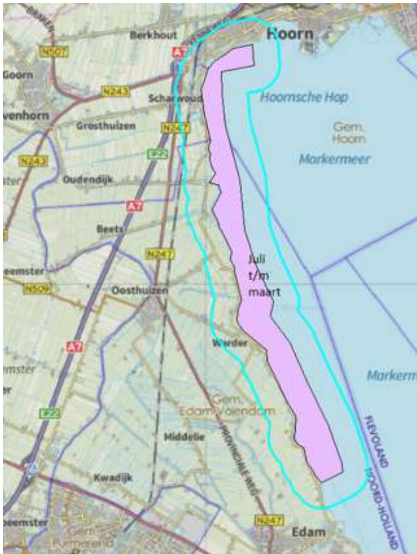
Figuur 4.8b. Verstoringgevoelige gebieden Markermeer en IJmeer niet-broedvogels. In de aangegeven periode geldt een verstoringzone van 700 m. De delen in Flevoland blijven buiten beschouwing.